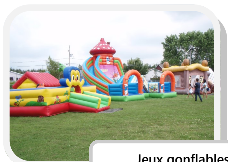
Jeux gonflables, au plaisir des petits.