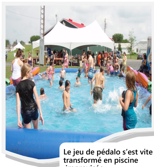
Le jeu de pédalo s'est vite transformé en piscine improvisée.